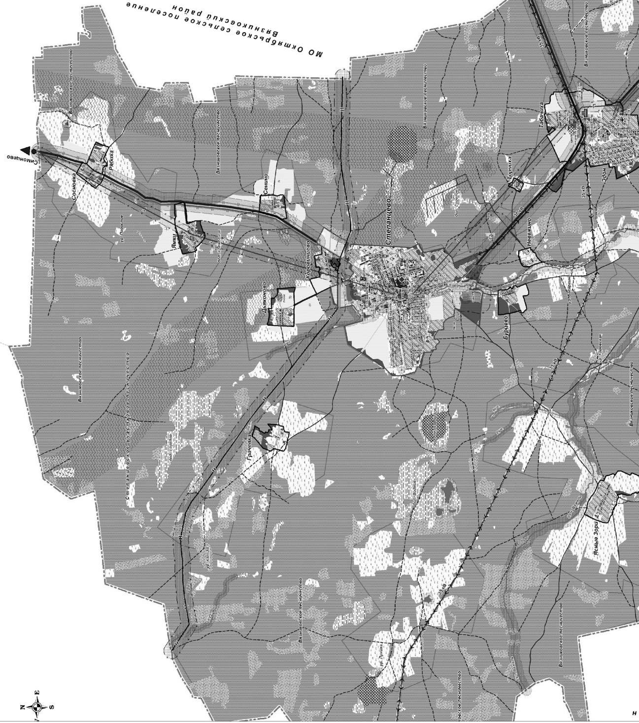
Схема расположения элементов планировочной структуры, связи парковки территории с дорогой, водопровод, канализация, проект планировки территории для размещения объекта строительства 10 "Саянтрансафтеф" : "Перевод МП "Газовые Присады" № 800 под плановую парковку. Перевод МПП "Газовые Присады" участок "Спартак-Новый" участка "Спартак-Новый-Восточный" 0-214 кв. Дл. 500 под парковку нефти. Сети связи". Сельские поселения Ступинского района Владимирской области.