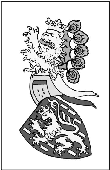
Герб рода фон Клинген

Местным штаб-лекарем Клинген оставался до первой половины 1810-х гг. Этот пост Густав Клинген занимал и во время Отечественной войны 1812 года с «Великой армией» императора французов Наполеона Бонапарта, когда в Коврове формировался 3-й пеший казачий полк Владимирского ополчения, а через город в тыл велись десятки и сотни раненых воинов, действовали временные госпитали, приходилось лечить заболевших военнослужащих из следовавших в действующую армию резервных полков.