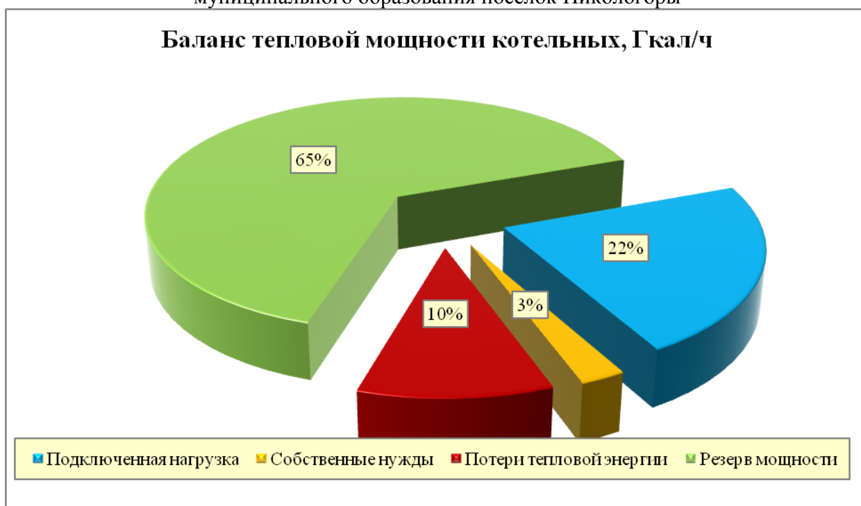
Рис. 3. Баланс тепловой мощности источников централизованного теплоснабжения

Таким образом, по состоянию на 2013 г. по содержанию Главы 5 Схемы теплоснабжения предлагаются следующие варианты инвестиций: