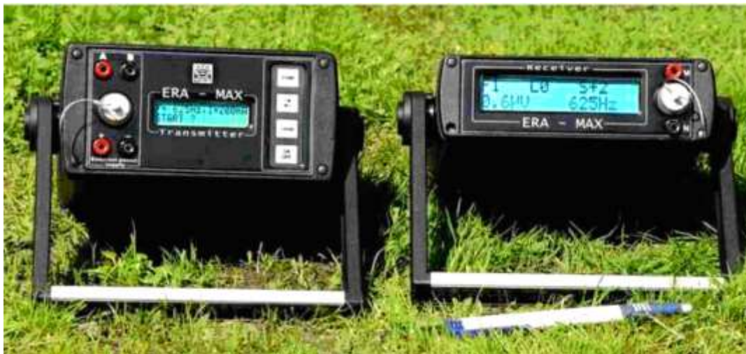
Рисунок 4.1 – Электроразведочная аппаратура ERA-MAX

Измерение потенциалов блуждающих токов на площадке изысканий выполнено по двум взаимно перпендикулярным направлениям при размере приемных линий MN=100 м. Время регистрации составило 15 минут с дискретностью наблюдений 15 сек.