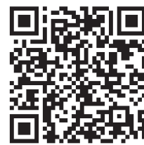
Ответы на задания предыдущего номера