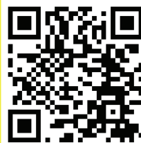
Атлас новых профессий

P.S. Внимание! Классные руководители, особенно старшеклассников, данные материалы вам в помощь для подготовки к независимой экспертизе и работе с родителями.