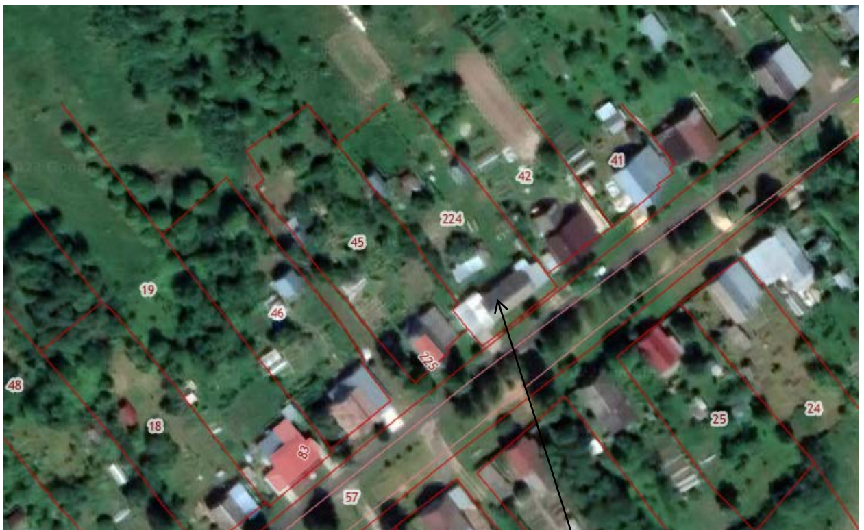
Земельный участок с кадастровым номером 33:08:090302:224