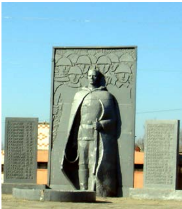
Рисунок 1. Памятник погибшим в Великой Отечественной войне

Во время Второй Мировой Войны на фронт ушли многие сельчане, а вернулись далеко не все. В память погибших в поселке Стёпанцево 23 октября 1967 года открыт обелиск.