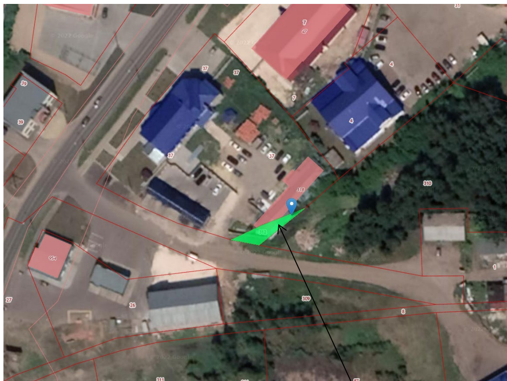
Земельный участок с кадастровым номером 33:21:020103:312