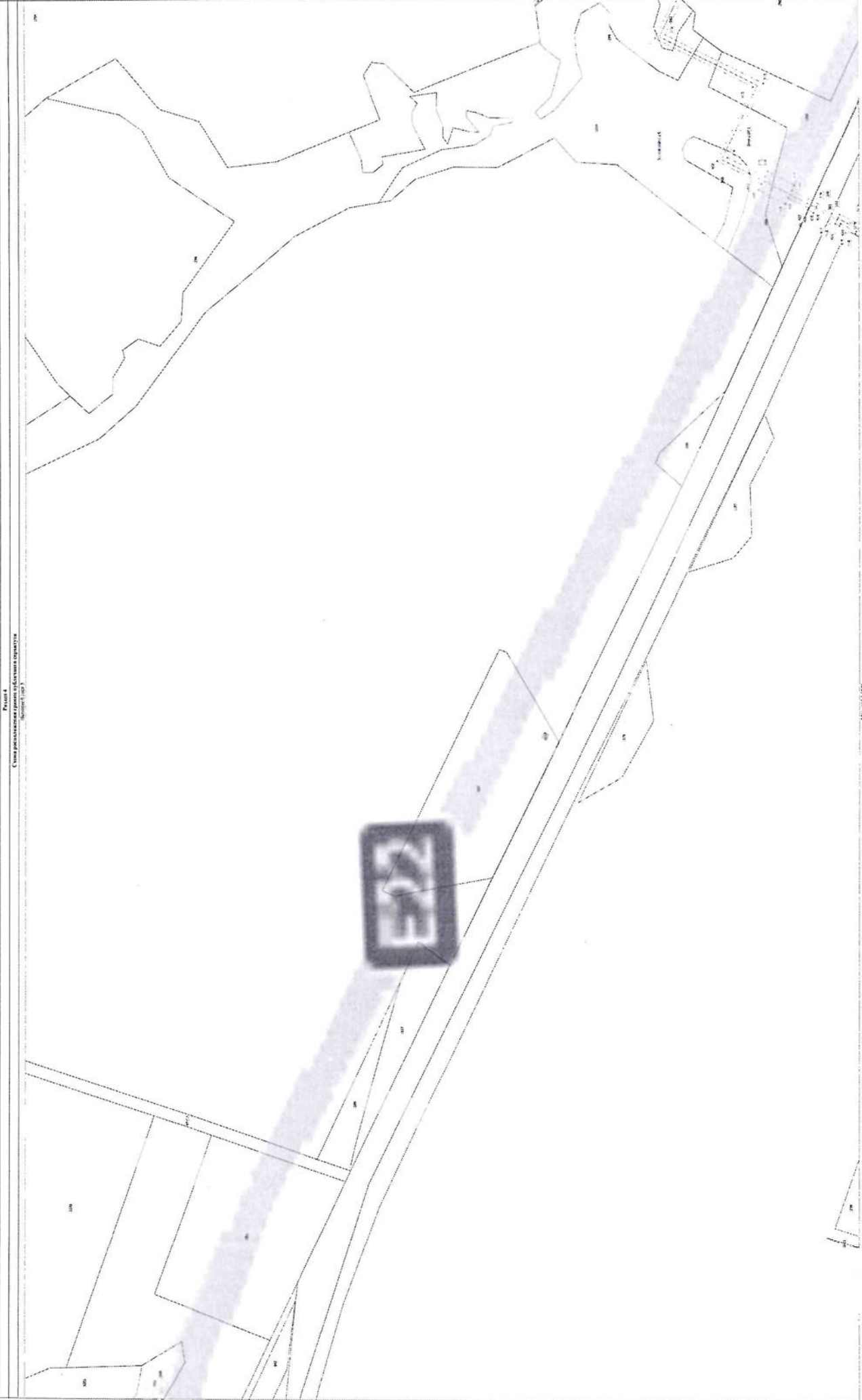
Рисунг 4 Схема расположения границ объектов строительства Итого: 1 лист