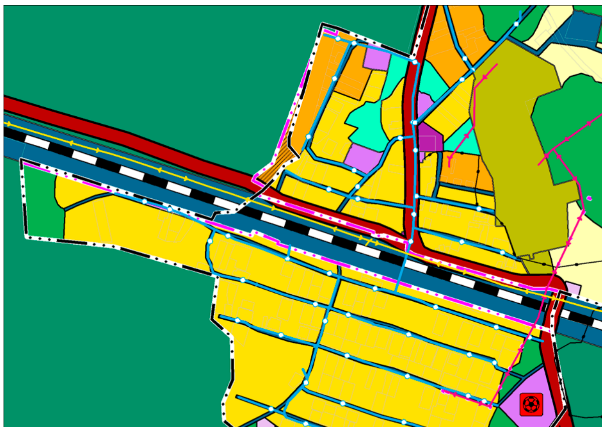
Рис. 2.1-1 Изменение границы п. ст. Сарыево

На территории около д. Высоково находятся фактически используемые, застроенные земельные участки индивидуального жилья, либо пересекаемые границей населенного пункта, либо расположенные за ее границами. Генеральным планом предлагаются мероприятия по уточнению границ данных населенных пунктов в части приведения в соответствие с ранее учтенными границами земельных участков, входящих в населенный пункт.