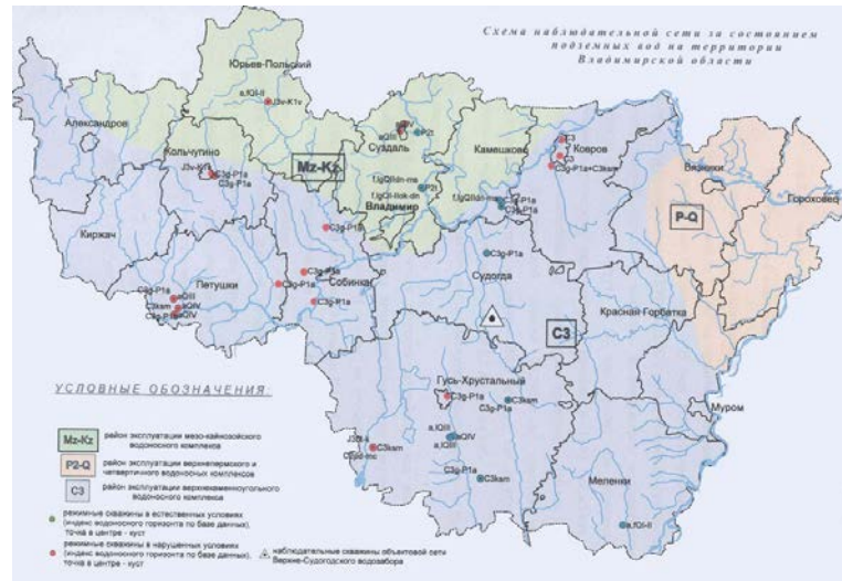
Рис.2 Схема наблюдательной сети за состоянием подземных вод на территории Владимирской области

Татарский водоносный горизонт вскрыт скважинами в районе города Вязники, поселка Никологоры и т. д., находится на глубине 13-65 м. Качество воды удовлетворительное.