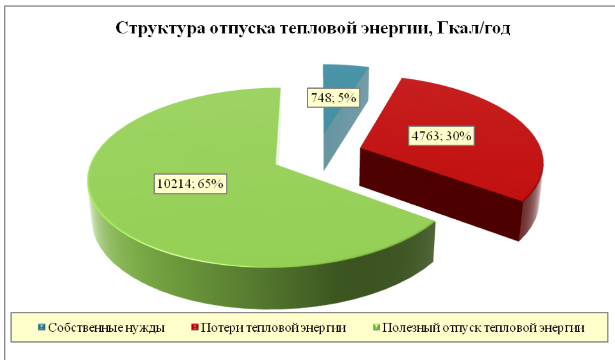
Рис. 2. Структура отпуска тепловой энергии по источникам централизованного теплоснабжения муниципального образования поселок Никологоры